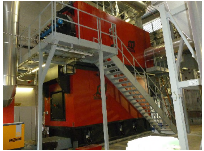
Chaudière biomasse (constituée principalement de déchets de coupes forestières venant d'un rayon <100 km du site)